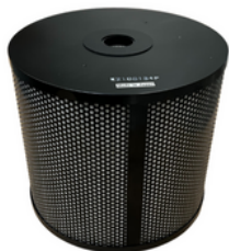
Filtre pocket filter F7 L287 x W592 x H265 mm