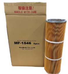
Oil Filtre MF-1546 (Sodick) - ORIGINAL (150x72x450)