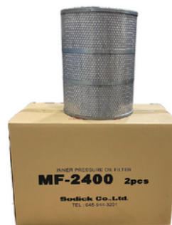
Oil Filter MF-2400 (Sodick) - ORIGINAL