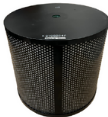
Filtre pocket filter M5 L287 x W592 x H250 mm